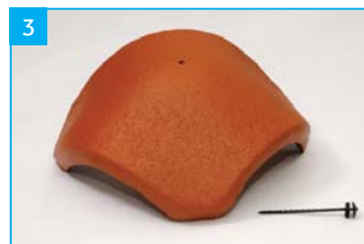
Rozdělovací hřebenáč s jedním vrutem Pro napojení hřebene a dvou nároží.