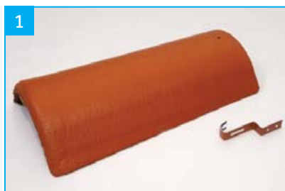
Hřebenáč s jednou příchytkou Pro pokrývání hřebene a nároží.