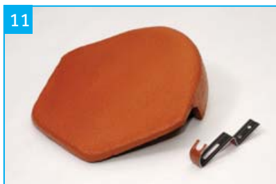
Uzávěra hřebene betonová s jednou příchytkou Pro zakončení hřebene sedlových střeš.