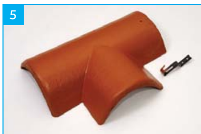
Rozdělovací hřebenáč pravý T 250 s jednou příchytkou Pro kolmé napojení dvou hřebenů v jedné rovině.