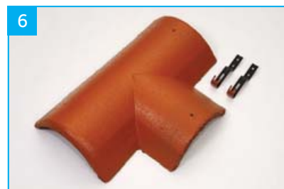
Rozdělovací hřebenáč pravý T 220 se dvěma příchytkami Pro kolmé napojení dvou hřebenů v jedné rovině.