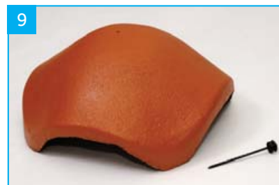
Rozdělovací hřebenáč XS s jedním vrutem Pro napojení čtyř nároží.