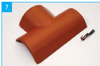
Rozdělovací hřebenáč levý T 250 s jednou příchytkou Pro kolmé napojení dvou hřebenů v jedné rovině.