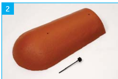
Koncový hřebenáč s jedním vrutem Pro spodní zakončení nároží.