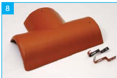
Rozdělovací hřebenáč levý T 220 se dvěma příchytkami Pro kolmé napojení dvou hřebenů v jedné rovině.