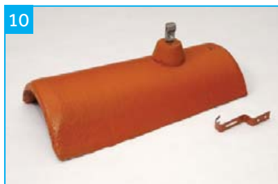
Hromosvodový hřebenáč s jednou příchytkou Pro upevnění vodiče hromosvodu na hřebeni a nároží.