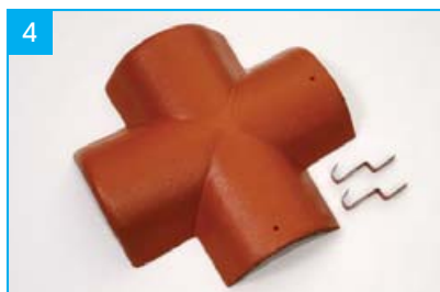
Rozdělovací hřebenáč X se dvěma příchytkami Pro kolmé napojení dvou protínajících se hřebenů v jedné rovině.