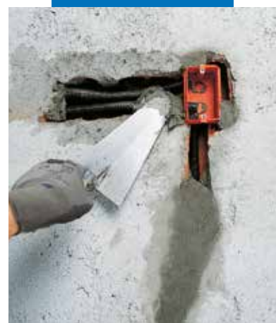
Fixace instalačních krabic a rozvodů elektro