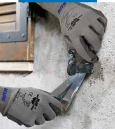
Osazení závěsů okenic s použitím Lampocemu