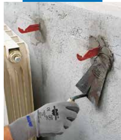
Osazení radiátorových konzol pomocí