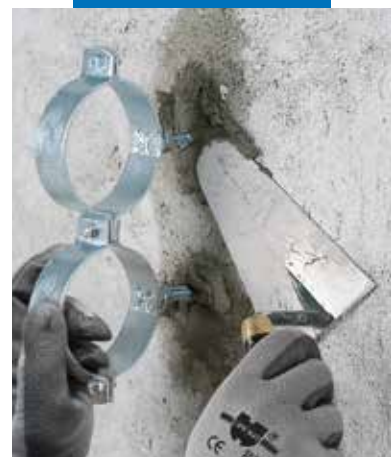
Osazení potrubních objímek s použitím Lampocemu